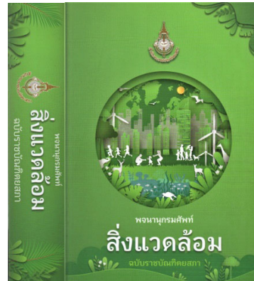
พจนานุกรมศัพท์สิ่งแวดล้อม

ชีวิตที่ราชบัณฑิตยสถาน เราสนิทกันมาก ช่วงที่คุณหมอเป็นนายกราชบัณฑิตยสถาน ทุกมื้ออาหารกลางวันคุณหมोजะชวนให้เข้าไปคุยในห้อง ช่วงนั้นคุณหมอดำเนินการให้ผู้เขียนเป็นบรรณาธิการวารสารราชบัณฑิตยสถาน เพื่อปรับปรุงคุณภาพ และแต่งตั้งผู้เขียนให้เป็นประธานกรรมการจัดทำพจนานุกรมศัพท์แพทยศาสตร์ และประธานกรรมการจัดทำพจนานุกรมศัพท์สิ่งแวดล้อมที่พิมพ์เผยแพร่แล้วเมื่อ พ.ศ. ๒๕๖๕