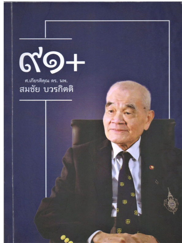
หนังสือผู้เขียนอายุ ๙๐+ ปี